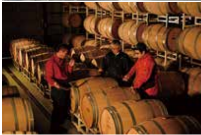
◎写真上/小ロット小仕込み用タンクを導入 ◎下/パレルテイस्टングを行い、樽ごと・品種ごとの特徴を確認し、ブレンドへ。

に向け、2012年から準備を始め、2015年に暗渠設備を設け植栽を開始。さらに2019年には高島町(農業委員会)の協力を得て拡張。特に、カベルネ・ソーヴィニヨンを中長期的な視点で植栽を行ってきたことで、区画ごと、樹齢の違い等による同品種のポテンシャルを確認できたことに加え、現在では樹齢3年と6年の区画から約4.2トンの収量を確保するまでに至りました。