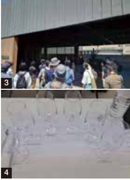
◎1／養成プログラムカリキュラム◎2／ワイン科学士養成プログラムテキストとレポート（一部）◎3／ワイナリー実地研修（山梨のワイナリー）◎4／ワイナリー実地研修（テイスティング）