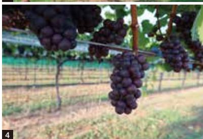
◎1・2/ナイトハーベスト収穫風景◎3/ヴィオニエ品種。◎4/ピノ・グリ品種。◎5/ピノ・ノワール収穫2023.9.9◎6/自社圃場ピノ・ノワール